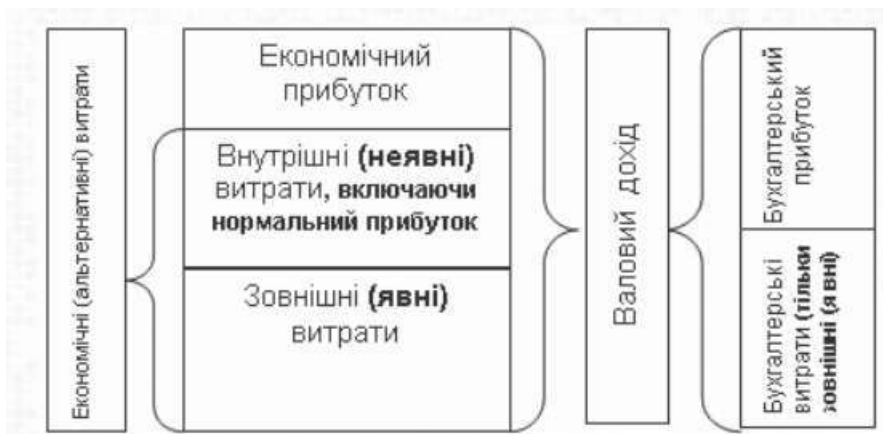
Рисунок 1 – Економічний і бухгалтерський прибуток

Економічний прибуток (чистий прибуток) - це різниця між загальним доходом і економічними витратами, які містять бухгалтерські (зовнішні) та внутрішні витрати, зокрема, й нормальний прибуток (рис. 1). Наявність економічного прибутку є показником ступеня вигідності відлучення ресурсів від альтернативного використання їх в іншому виробництві.