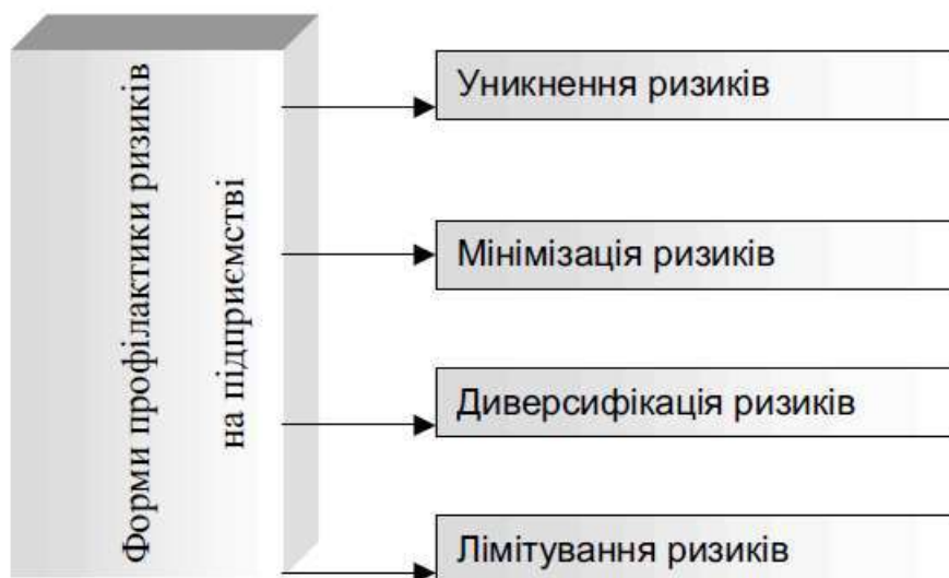
Рисунок 1 – Основні форми профілактики ризиків

Наступним етапом є безпосереднє використання прийомів і методів зниження ризику. У системі заходів щодо управління ризиками на підприємстві головна роль належить їх профілактиці. Група заходів для профілактики ризиків покликана забезпечити зниження імовірності їх виникнення. У системі ризику менеджменту використовуються звичайно такі форми профілактики ризиків (рис. 1).