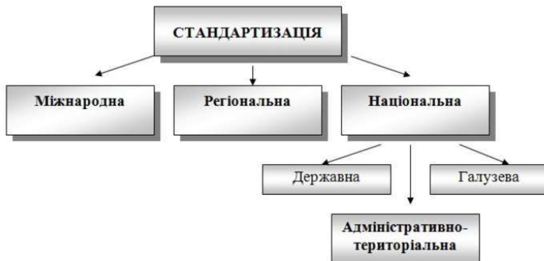
Рисунок – 1 Рівні стандартизації

Міжнародна стандартизація – стандартизація, яка проводиться на міжнародному рівні, брати участь у якій можуть відповідні органи всіх країн.